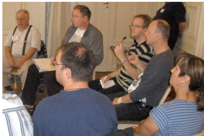
Gruppdiskussion kring frågor som rör gruppen hörselskadade i yrkesverksam ålder

(*förklaring: Gysinge folkhögskola är en skola för alla även om PRO är huvudman)