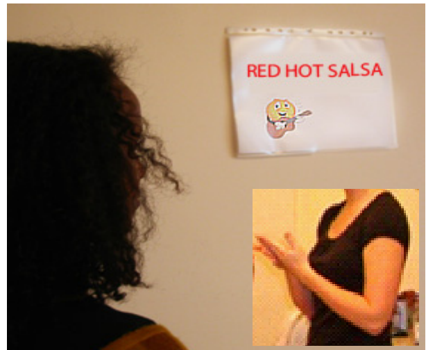
Danserna har personliga namn och tecken