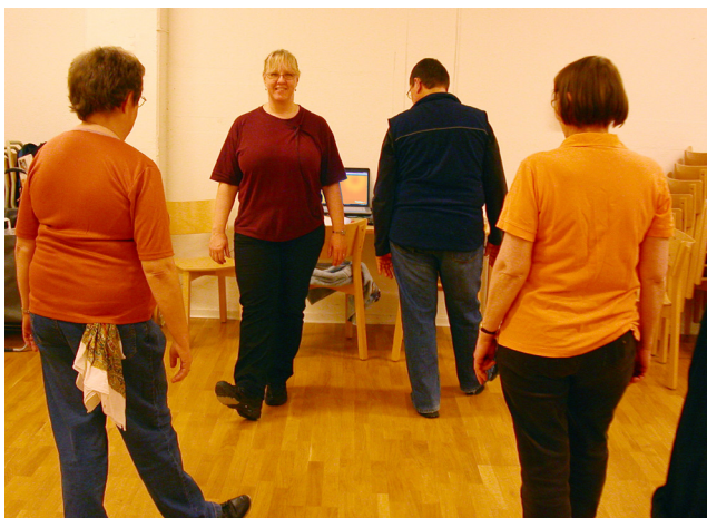
Jag är vänd emot deltagarna medans min kollega är "rättvänd"

Om jag inte, av någon anledning, har några "extra fötter" att tillgå, instruerar jag först vad som ska göras vänd emot deltagarna och sedan vänder jag mig om och visar stegen från "rätt" håll. Det går bra men en fördel att vara vänd emot deltagarna är att jag kan observera om alla hänger med och har uppfattat mina instruktioner på rätt sätt.